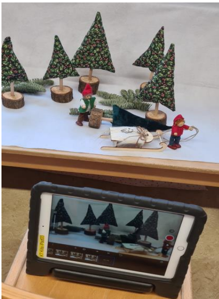
Hier entsteht ein richtiger Film

Und während die Kinder für den Film selbst keinen Ton haben wollten, sollte dafür zum Schluss als Überraschung für die Eltern das eingesungene Lied „Wir wünschen euch frohe Weihnacht“ erklingen. „Jedes Detail in diesem Film wurde wirklich bewusst und mit viel Liebe von den Mädchen und Jungen entschieden“, erklärt der Kita-Erzieher lachend.