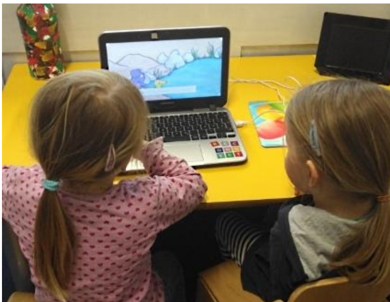
Der Kita-Computer

Auch im Fall des jungen Schachprofis diente der Computer als Unterstützung seines Lernprozesses. Die Leiterin hatte während seiner Kita-Zeit sehr früh bemerkt, dass der Junge unterfordert war. Zur individuellen Förderung wurde Frau Förster daher das Schachspiel empfohlen. „Leider habe ich davon selber wenig Ahnung“, gesteht sie. Deshalb habe sie das PC-Kinderschachspiel „Fritz & Fertig“ angeschafft. Die digitalen Erfahrungen hat der Junge anschließend selbstständig und mit großer Begeisterung „analog“ aufs Schachbrett übertragen.