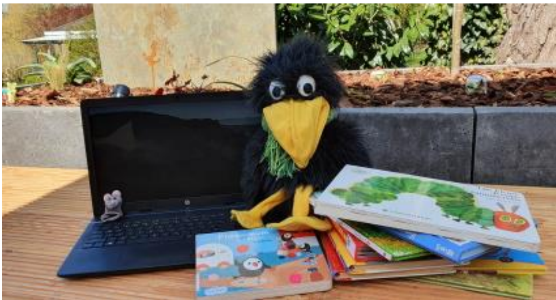
Leserabe Klaus

Seit 2021 kann der Rabe seine kleinen Freunde allerdings wegen Corona nicht mehr bei sich empfangen. Stattdessen trifft sich die Mäusebande nun Monat für Monat zur bekannten Uhrzeit digital. Mama und Papa fehlen wie bei den Besuchen im Medienzentrum auch im digitalen Raum nicht. Ebenso wenig die Handpuppe Klaus, gefolgt von Joelle.