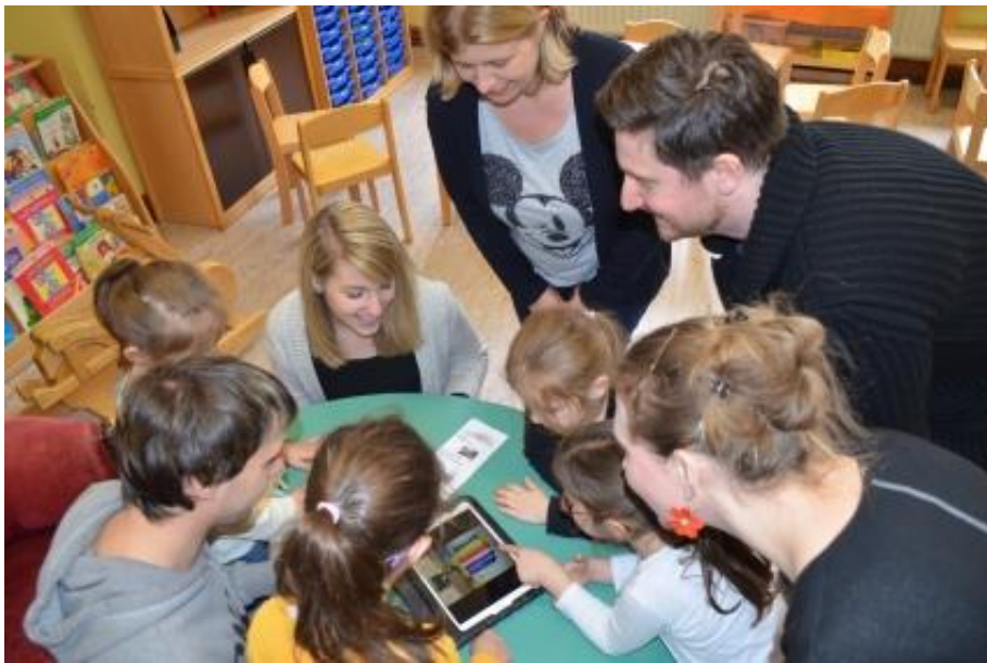
Gemeinsames Bestaunen der Fotos.

Im Gegensatz zu gewöhnlichen Kameras ermöglichen Tablets durch die größere Bildschirmfläche, dass mehrere Kinder sich gleichzeitig die Bilder anschauen können. Zudem ist die Bedienung kinderleicht. Eine Schutzhülle wird an dieser Stelle sehr empfohlen, um nicht nur das Gerät vor möglichen Stürzen zu schützen, sondern durch einen Griff auch für jüngere Kinder leichter zu halten.