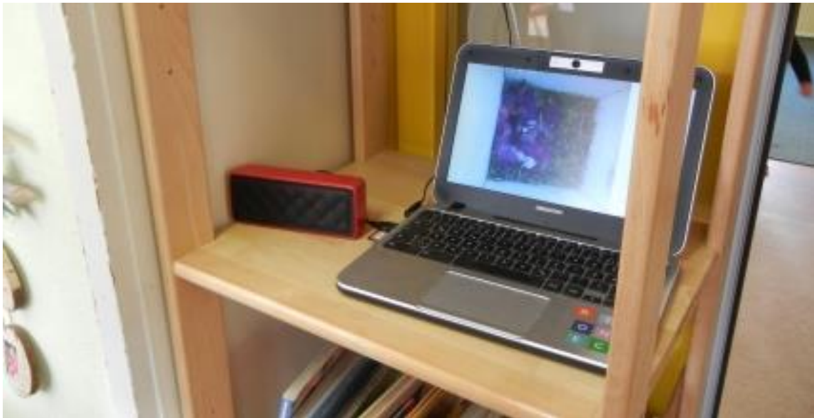
In jeder Gruppe kann das Geschehen im Brutkasten beobachtet werden.