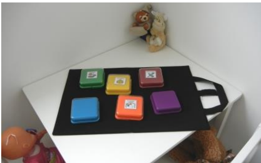
Big Points in der Kita @ KiTa Löwenburg

Nüßler hat zwar einen extra Raum, wo sie die verschreibungspflichtigen Einzeltherapien durchführt. Doch idealerweise bleiben die Mädchen und Jungen in ihren Gruppen. Hierfür berät sie auch ihre Kolleginnen und Kollegen. „Die Kinder sind durch den Austausch mit den Gleichaltrigen einfach viel motivierter, die Übungen zu machen“, so Nüßler. Wenn die Big Points beispielsweise mit Tiermotiven bestückt und mit den dazugehörigen Tiergeräuschen bespielt sind, ist jedes Kind ganz gleich seiner Fähigkeiten und besonderen Bedarfen bemüht, als Erstes auf den richtigen Big Point zu hauen.