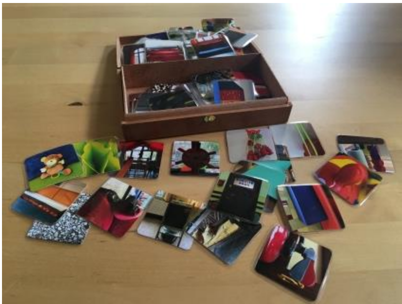
Selbstgemachtes Kita-Memory mit dem Tablet

Nachdem die Erzieher*innen die zahlreichen Pärchen ausgedruckt und laminiert hatten, erhielt jede der drei Gruppen ein analoges Kita-Memoryspiel mit besonderen Motiven aus der Perspektive der Vorschulkinder.