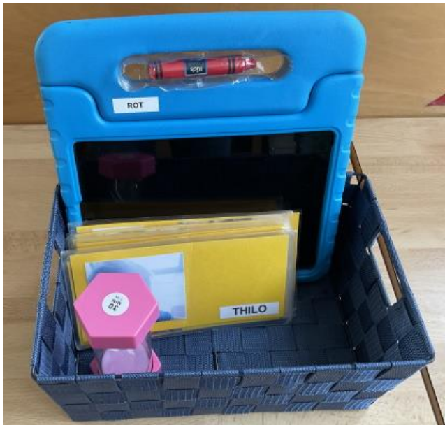
Die Tablet-Station

Die Kita Klatschmohn verwendet vier Teile aus der Montessori Vorschul App, die sie erst einmal für ein Jahr gekauft hat. „Eine Aufgabe ist zum Beispiel, dass die blau-roten Stangen gezählt werden und in der App angemalt werden“, erklärt die Kita-Leitung. Aufgrund des Erfolges bei den Vorschulkindern strebt die Kita an, das App-Angebot auch zukünftig wieder zu erwerben.