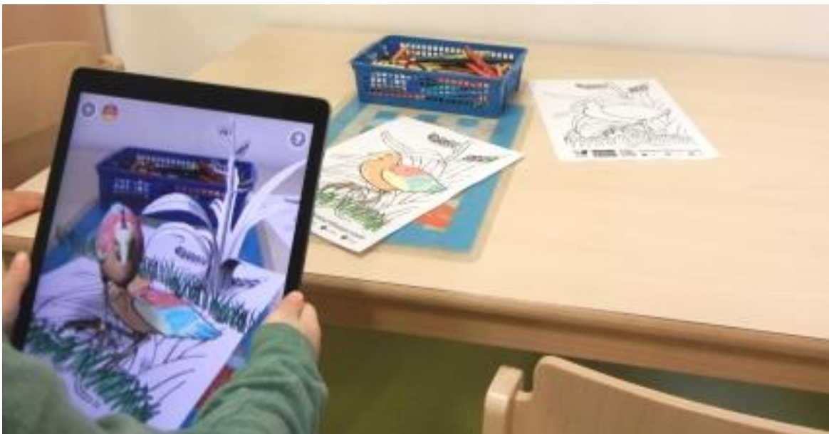
Gemalte Kinderbilder werden zum Leben erweckt @ KiTa Passstraße 123

Als die Eltern der „Piraten-Kinder“ eines Nachmittags wie gewöhnlich ihre Sprösslinge abholen wollten, wurden diese bereits sehnsüchtig erwartet. Völlig begeistert wollten die Kinder ihnen ihre Ausmalbilder von Quiver zeigen, die mithilfe des Tablets lebendig wurden. „Anfangs dachten die Kinder, dass es nur ein gewöhnliches Video sei, das sie sehen“, sagt Gößwein. Doch als die kleinen Piraten dann auf dem Display nicht nur ihr gemaltes Bild in 3D sahen, sondern auch die eigenen Schuhe und andere reale Gegenstände erkannten, waren sie nicht mehr zu halten und produzierten zahlreiche Bilder in unterschiedlichsten Farben.