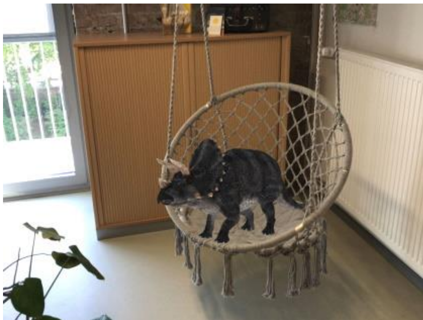
Auch Dinos schaukeln gerne!

Die zu den MySmartFlash-Karten dazugehörige kostenlose App erlaubt auch, Fotos von den digitalen Tieren in der realen Welt zu machen. Somit können Kinder nicht nur fotografisch kreativ werden, sondern auch zu dem entstandenen Motiv eigene Geschichten erfinden. Und ganz nebenbei erhalten sie als Erinnerung zum Abschluss auch noch ein Bild.