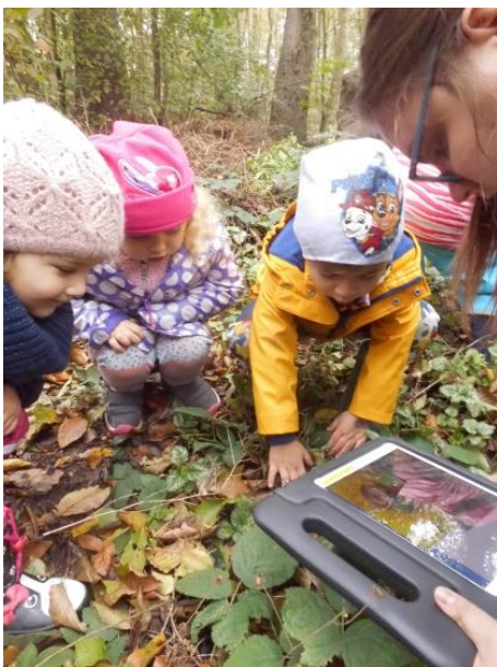
Mit dem Tablet in der Natur