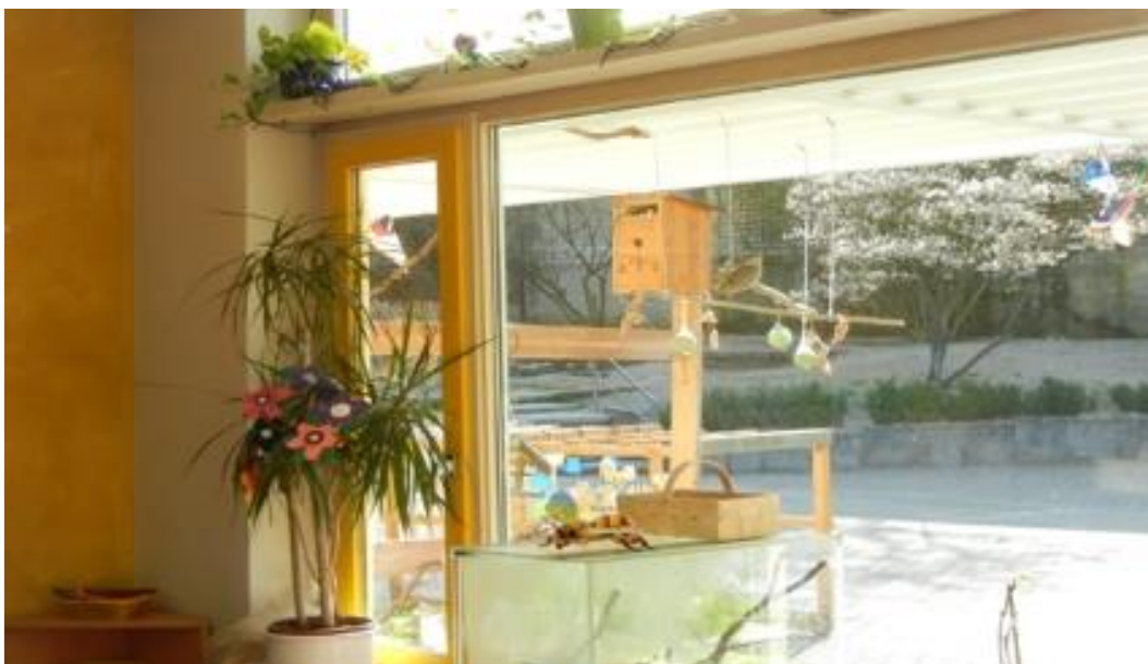
Der Brutkasten hängt für die Kinder gut sichtbar auf dem Außengelände der Kita RoKoko

Bei Tpsi und Tapsi, wie die RoKoKo-Kinder das derzeitige Meisenpaar nennen, geschieht momentan viel im neugebauten Nest. Drei Eier wurden bereits gelegt, weitere werden in den nächsten Tagen erwartet. Die Brutzeit dauert in der Regel 9-14 Tage. Damit lassen sich die Baby-Meisen wahrscheinlich dieses Jahr passend zu Ostern das erste Mal blicken. Nach dem Schlüpfen verharren Meisenfamilien hier gewöhnlich noch 2-3 Wochen, bevor sie sich dann auf die Reise begeben.