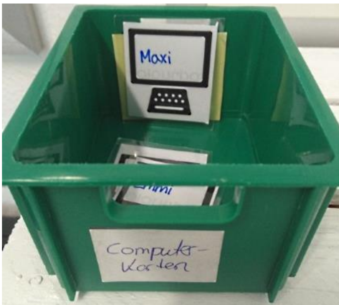
Computerkarten für die aktive und passive Nutzung

Maximal zwei Karten dürfen pro Tag eingelöst werden. Gefahr eines Suchtverhaltens? Fehlanzeige. Die Erfahrung zeigt, dass die Kinder nur ein einziges Mal alle Karten am Wochenanfang aufbrauchen. Danach verteilen sie die Karten lieber über die gesamte Woche und lösen sie nur für etwas ein, das sie wirklich interessiert. Da dies in der Kita so erfolgreich ist, haben mittlerweile sogar einige Eltern Zuhause Computerkarten eingeführt.