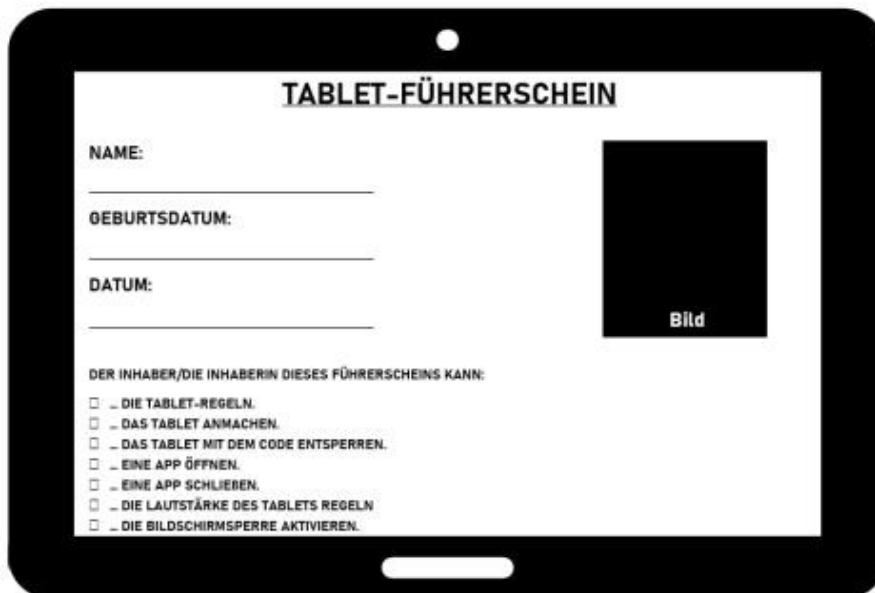
Der Tablet-Führerschein für die Kinder

Etwas, an das sich die Erzieherin auch noch sehr gerne zurückerinnert, ist die Nutzung der FieteZoo-App. „Diese haben wir genutzt, um das Thema Emotionen zu besprechen. Die Kinder machten Bilder oder Fotos von traurigen und fröhlichen Gesichtern sowie von anderen Gefühlsausdrücken und hinterlegten diese hinterher mit passenden Geräuschen.“