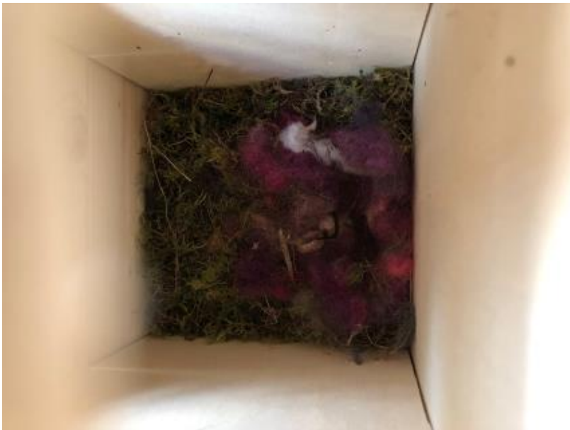
Ein Blick auf das Nest mit dem Auge der Webcam

Thissen, selbst Technik- und Naturliebhaber, hat vor fünf Jahren das Projekt ins Leben gerufen: „Es war mir immer schon ein großes Anliegen, diese beiden Bereiche zu verknüpfen. Hier in der Kita legen wir großen Wert darauf, den Kindern den respektvollen Umgang mit der Natur zu vermitteln. Durch die Brutkasten-Webcam verhindern wir, dass in den Vogelnestern herumgewühlt wird, um beispielsweise die gelegten Eier sehen zu können.“