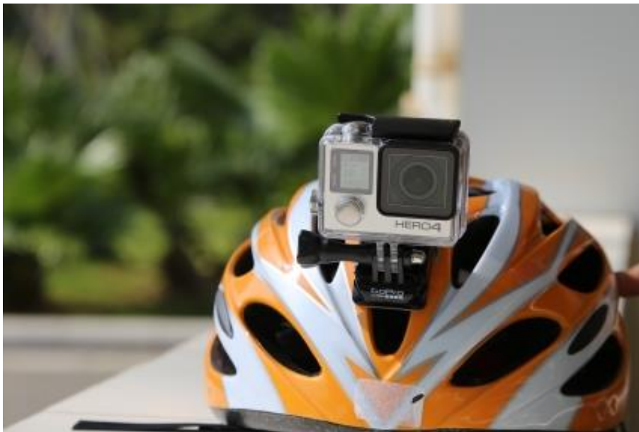
Mit der GoPro die Welt erkunden

Die Vorschulübernachtung in der Kita Spielwiese in Aachen steht kurz bevor. Stolz dreht sich eines der Vorschulkinder um: „Guck mal, ich hab eine GoPro auf dem Kopf!“ Die kleine Actionkamera „GoPro“ darf bei der Kitaübernachtung wirklich nicht mehr fehlen. Denn seit zwei Jahren wird dieser besondere Tag von den Vorschulkindern mit Begeisterung selbst gefilmt.