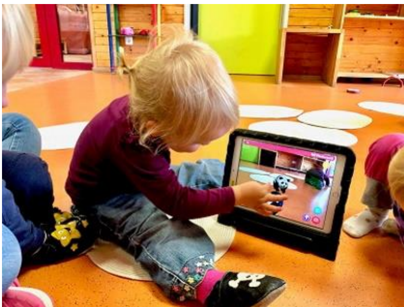
Augmented Reality in der Kita

Doch nicht nur die Tiere auf den Karten scheinen plötzlich in der durch das Tablet zu beobachtenden Umgebung aufzutauchen. Gleichzeitig spricht auch eine angenehme Stimme den entsprechenden Tiernamen laut aus. Die App stellt hierfür elf verschiedene Sprachen bereit. „Das ist insbesondere für unsere jüngsten Kinder ganz toll, da die Verknüpfung von Bild und Wort ihnen beim Erlangen des Wortschatzes in Englisch und Deutsch hilft“, erklärt die englischsprachige Erzieherin begeistert.