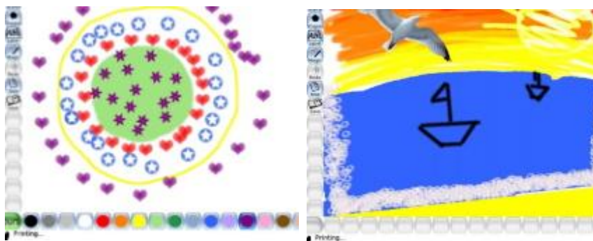
Die Ergebnisse können sich sehen lassen

Die Kita-Leiterin Jakob stellte fest: „Alle Erzieher*innen und alle Kinder haben durch den Einsatz der Tablets viele neue tolle Erfahrungen sammeln können.“ Mit Hilfe der App „Fietes Zoo“ wurden die individuellen Bastelideen der Kinder digital zusammengeführt. Die Zusammenstellung der einzelnen Tiere in einer App stärkte das Gruppen- und Gemeinschaftsgefühl der Kinder. Äußerst beliebt bei den Kindern war ebenfalls die kreative Mal-App „Tux Paint“. Die Kinder konnten mit ihren Fingern oder mithilfe eines Tabletstifts in Wachmalstift-Optik kreative Bilder erstellen, Traumwelten erschaffen oder Mandalas entwerfen. Der Fantasie der Kinder sind dabei keine Grenzen gesetzt.