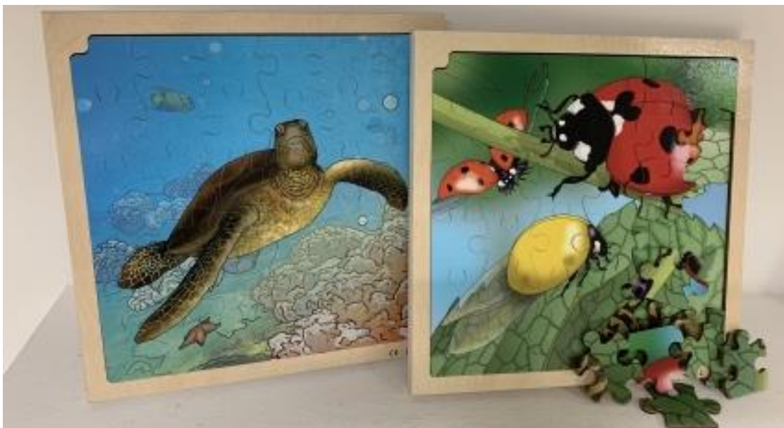
Mit digitalen Medien Puzzles erweitern