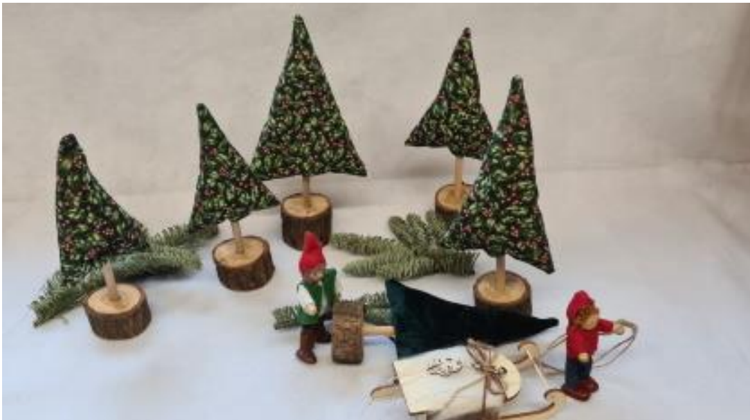
Materialien für den Weihnachtsfilm

Das Weihnachtsfest ist für Kinder eine wichtige Tradition. Unter anderem bietet ihnen ein solches Fest durch seine alljährliche Wiederholung neben der schon ohnehin großen Vorfreude an das Fest auch ein hohes Maß an Sicherheit und Orientierung.