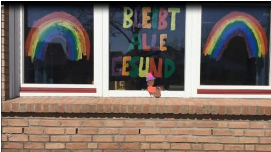
Botschaften für die Kinder

„Von Beginn an haben wir die Eltern angerufen, einfach, um uns zu erkundigen, wie es Ihnen und den Kindern zu Hause geht“, so Leuner. Bemerkenswert sei gewesen, dass es eine starke Gemeinschaft innerhalb der Elternschaft gegeben habe. So seien über diese Tipps ausgetauscht worden, wie die Familien die plötzlich entstandenen gemeinsamen 24 Stunden gestalten können. Abhängig der gegebenen Umstände war dies für manche leichter oder schwerer zu realisieren. Daher war es der Kita umso wichtiger, dass alle Kinder ganz gleich der vorliegenden Gegebenheiten zumindest zum Anlass des diesjährigen, ausgefallenen Kita-Osteressens die gleiche kleine Überraschung bekämen.