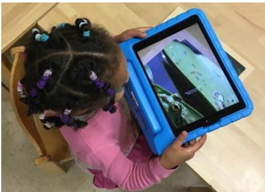
Über den Einsatz der Tablets wurden vorab die Eltern informiert

Neben der Montessori-Lernapp in der Kita kommt das Tablet aber auch für andere Zwecke zum Einsatz. So ist dieses ein gern genutztes Werkzeug im Außengelände oder bei Ausflügen, um die Tier- und Pflanzenwelt zu erkunden. Vertiefend kommen hier situativ auch die Wachstumspuzzles von Rolf zum Einsatz, die in Kombination mit der passenden App den kleinen Forscherinnen und Forschern die abgebildeten Tiere über ein Video in der Realwelt zeigen.