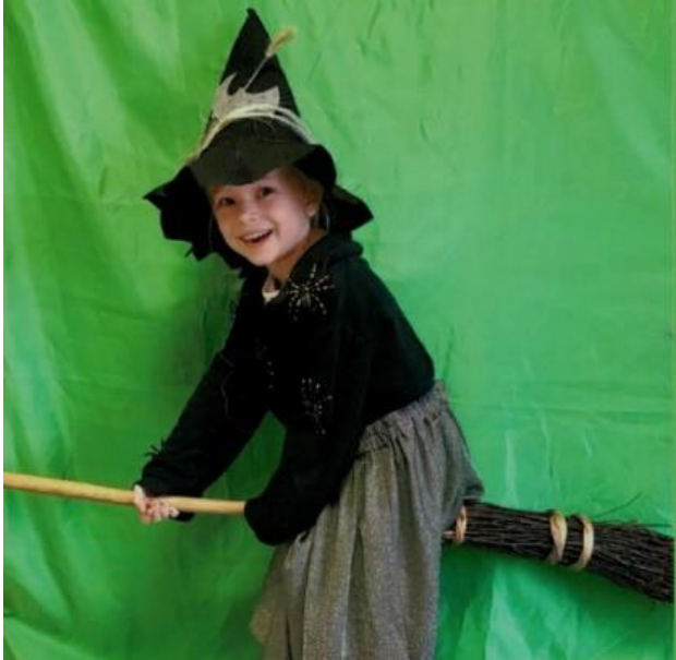
Fliegen vor dem Greenscreen

Jedes Kind durfte sich nacheinander als Hexe verkleiden und in seiner neuen Gestalt nach vorne auf den Stuhl kommen. „Die Kinder waren teilweise ganz in ihrer Rolle als Hexe vertieft, als sie nach vorne verkleidet kamen“, erzählt Feiertag begeistert.