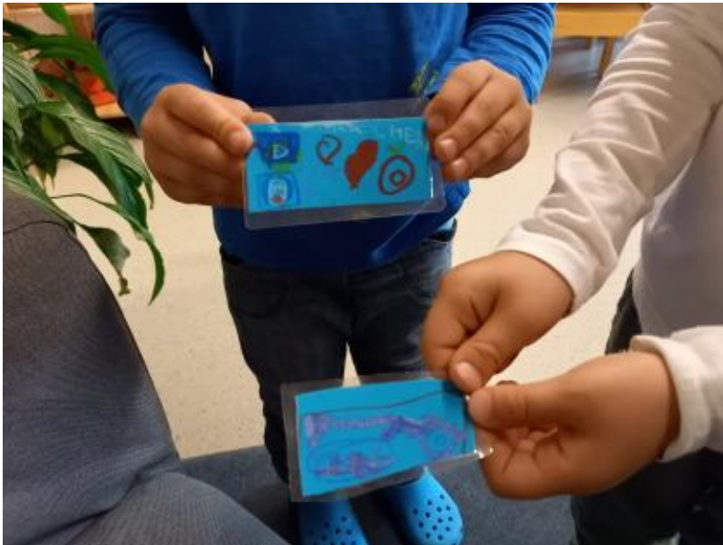
Der CD-Führerschein

Weiterhin gilt, dass die Kinder nur den CD-Player benutzen dürfen, wenn es die jeweilige Situation zulässt und vorab alle im Raum Anwesenden diesem zugestimmt haben. „Wenn die Musik jemanden stört, dürfen die Kinder auch mal alleine mit dem Gerät in die Turnhalle ausweichen und da zum Beispiel ihre Stoptänze üben“, erzählt der Erzieher verständnisvoll. Einzig und allein beim Essen gilt das eiserne Verbot, das CD-Gerät laufen zu lassen.