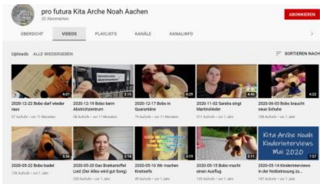
Ein eigener YouTube-Kanal in der Kita

In der Kita gelingt die Förderung alltagsintegrierter Sprache insbesondere über den persönlichen Kontakt und den Dialog zwischen Kindern und Erzieher*innen. Wie dies auch kontaktlos gelingen kann, testete die eigens dreifache Mutter schließlich ab der 2. Lockdownphase intensiv aus. Gemeinsam mit den anderen Kolleg*innen gelang es, einen eigenen YouTube-Kanal zu erstellen, der nach und nach bestückt wurde. Als Ergebnis stand am Ende unter anderem eine kleine „Bobo-Bär“-Filmreihe auf dem YouTube Kanal der pro futura Kita Arche Noah Aachen.