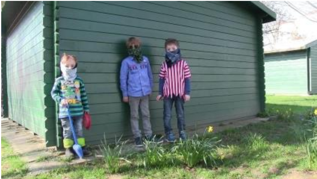
Filmszene