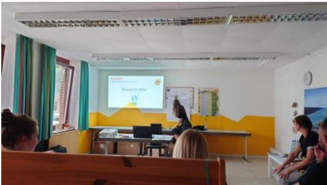
Ein Blick in die Fortbildung Digitale Medien und sensible Kinder

Die Erzieher*innen der Kita St. Marien in Würselen berichteten nach der Qualifizierung, dass sie die Kinder von einer ganz anderen Seite kennenlernen durften. Die eher sensiblen Kinder, die im Kitaalltag etwas ruhiger und zurückhaltender sind, kamen bei dem Einsatz der Tablets mehr aus sich heraus und waren den Erzieher*innen und anderen Kindern gegenüber aufgeschlossener, berichtete die Leiterin Stefanie Jakob. „Beim Umgang mit