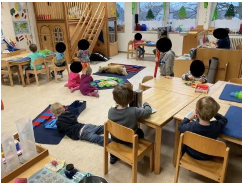
Digitale Medien in der Montessori-Kita