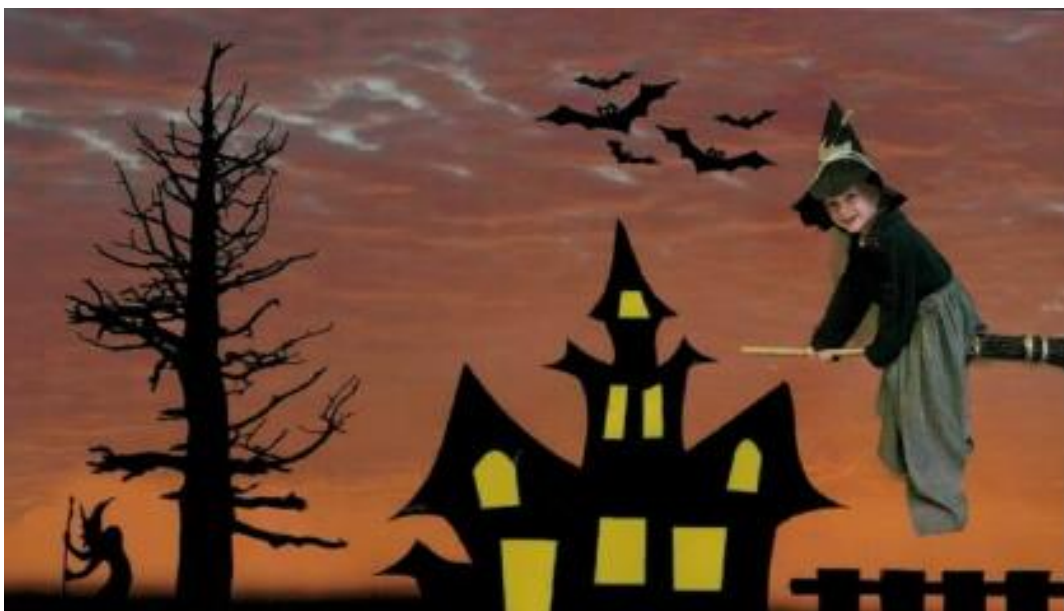
Mit Filmen zaubern