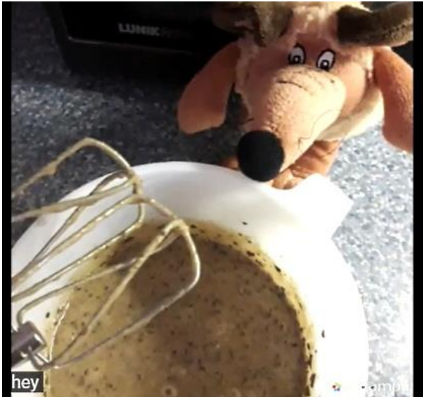
Bobo backt