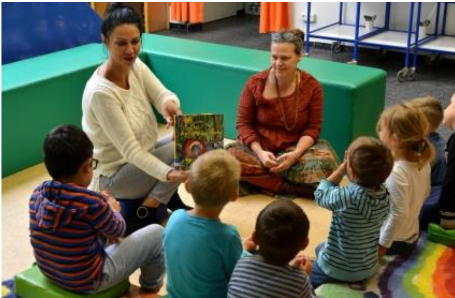
Vielsprachige Vorlesestunde mit Eltern in der Kita „Albert-Maas-Straße“.