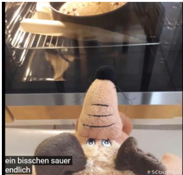
Und Bobo macht Mut